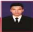
"Buceni" PT. Tiga Bintang Sejahtera Admin